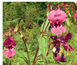
Drüsiges Springkraut Impatiens glandulifera Blüten und Samen