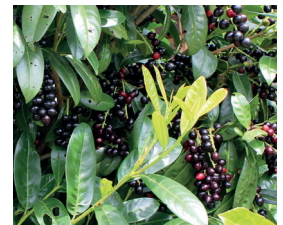
Kirschlorbeer Prunus laurocerasus Früchte und Wurzeln