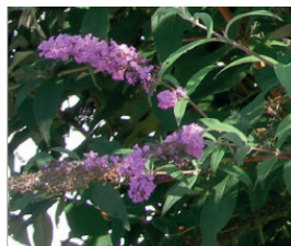
Sommerflieder Buddleja davidii Blüten und Samen