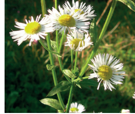
Einjähriges Berufkraut Erigeron annuus Ganze Pflanze