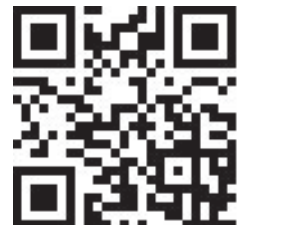
Weitere Pflanzen und Informationen

Wo Sie den Neopyhtensack kostenlos beziehen und wo Sie ihn entsorgen können, entnehmen Sie bitte dem Abfallkalender Ihrer Gemeinde. Grössere Mengen an Ast- und Wurzelmaterial können direkt bei der KVA Thurgau oder beim ZAB angeliefert werden.