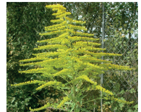
Amerik. Goldruten Solidago canadensis, S. gigantea Wurzeln, Blüten und Samen