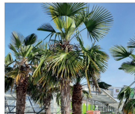
Hanfpalme Trachycarpus fortunei Blüten und Früchte