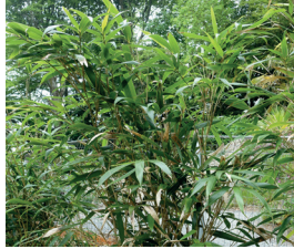
Japanischer Bambus Pseudosasa japonica Wurzeln, Blüten und Samen