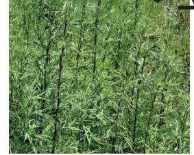
Verlotscher Beifuss Artemisia verlotiorum Wurzeln, Blüten und Samen