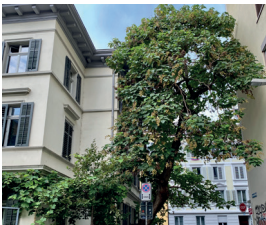
Blauglockenbaum Paulownia tomentosa Wurzeln, Blüten und Samen