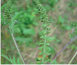
Ambrosia Ambrosia artemisiifolia Ganze Pflanze

Alle fortpflanzungsfähigen Pflanzenteile von exotischen Problempflanzen werden im Neopyhtensack entsorgt.