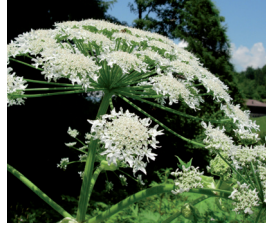
Riesenbärenklau Heracleum mantegazzianum Wurzeln, Blüten und Samen