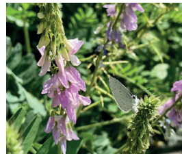
Geissraute Galega officinalis Hülsenfrüchte