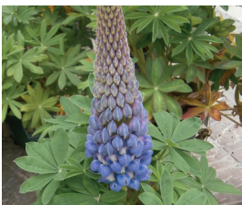
Vielblättrige Lupine Lupinus polyphyllus Blüten und Samen