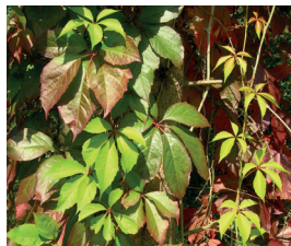
Jungfernrebe Parthenocissus agg. P. inserta/P. quinquefolia Ganze Pflanze