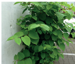
Staudenknöteriche Reynoutria japonica, R. sachalinensis, R. bohemica Alles Pflanzenmaterial aus dem Boden