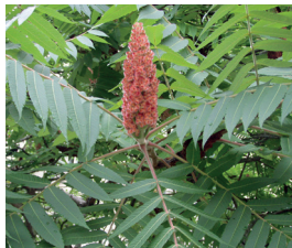
Essigbaum Rhus typhina Wurzeln, Blüten und Samen