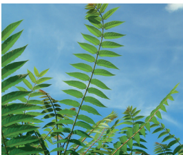
Götterbaum Ailanthus altissima Wurzeln, Blüten und Samen