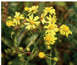
Schmalbl. Greiskraut Senecio inaequidens Ganze Pflanze