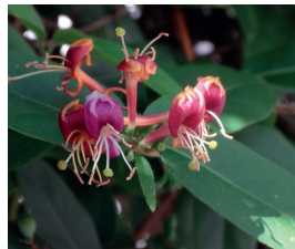
Asiatische Geissblättr Lonicera henryi, L. japonica Ganze Pflanze