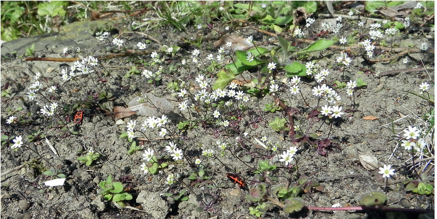
Frühlings-Hungerblümchen – Draba verna